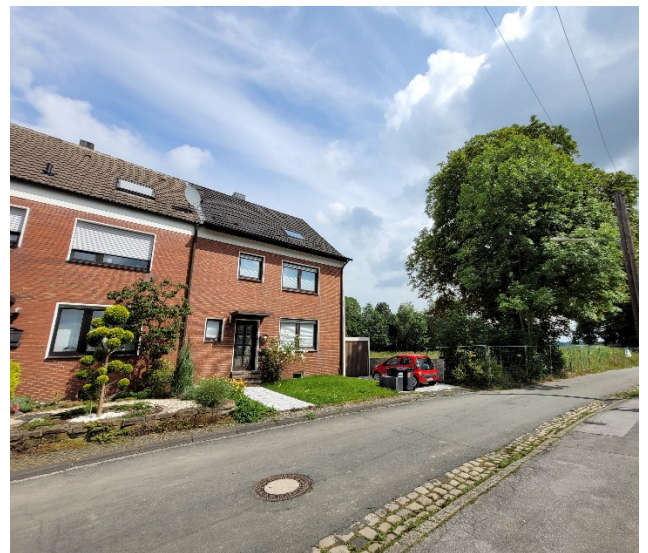
Abbildung 4: Umgebung