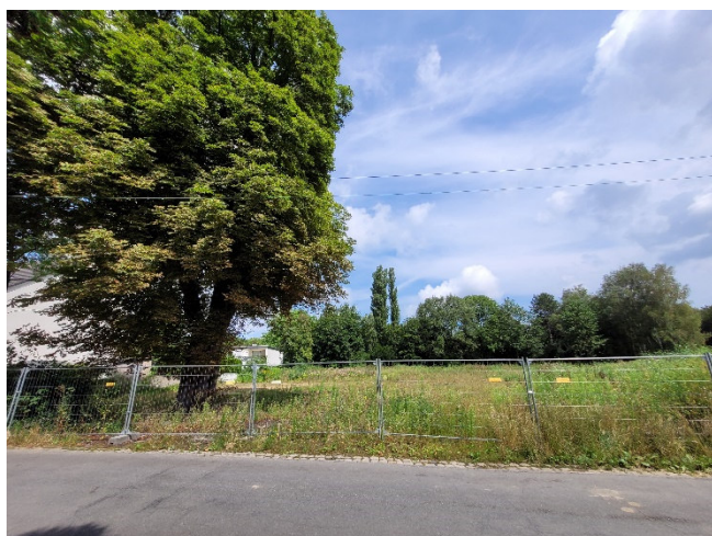
Abbildung 5: Grundstück