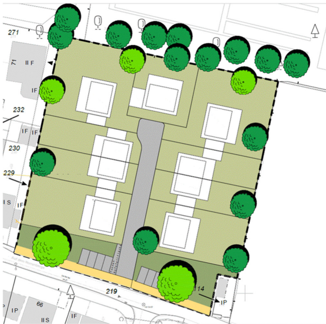
Abbildung 1: Unverbindlicher Bebauungsvorschlag