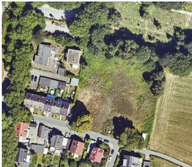
Abbildung 3: Auszug Luftbild